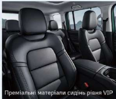
Преміальні матеріали сидінь рівня VIP