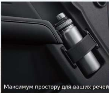
Максимум простору для ваших речей