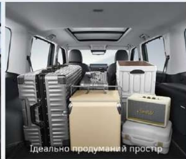
Ідеально продуманий простір