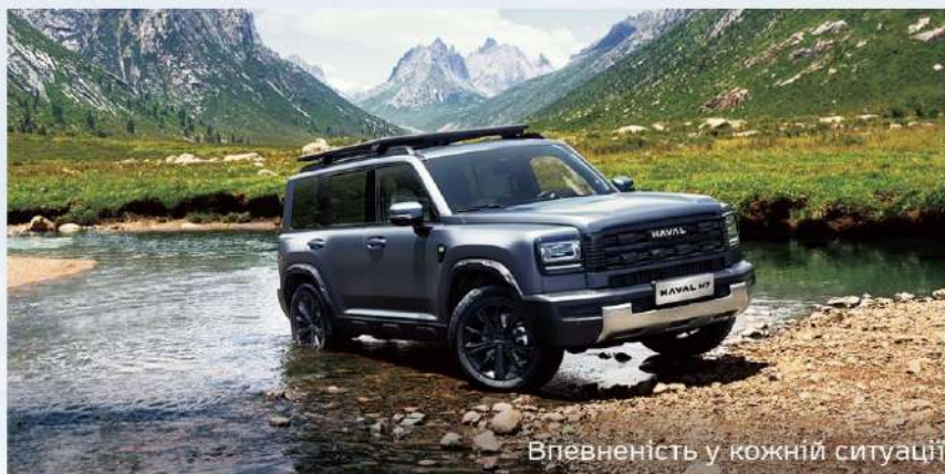
Впевненість у кожній ситуації