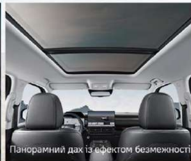
Панорамний дах із ефектом безмежності