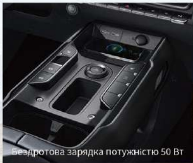
Бездротова зарядка потужністю 50 Вт