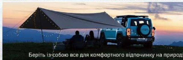
Беріть із собою все для комфортного відпочинку на природі