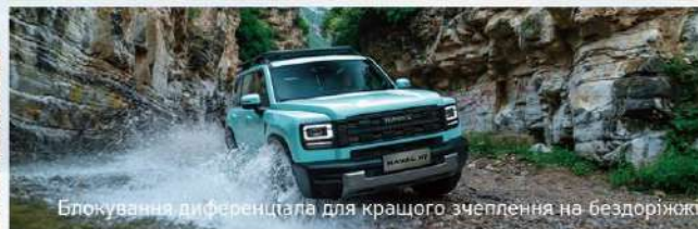
Блокування диференціала для кращого зчеплення на бездоріжжі