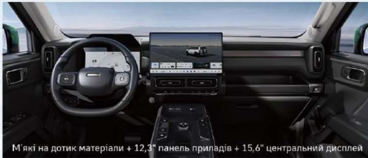
М'які на дотик матеріали + 12,3" панель приладів + 15,6" центральний дисплей